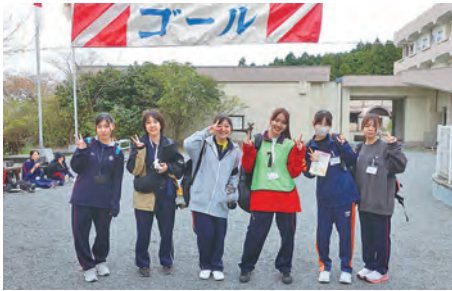
新入生フレッシュマン研修