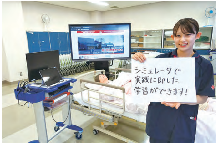
ピア・ラーニングルーム